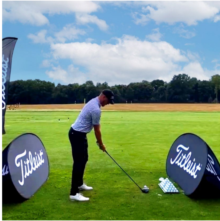
Oriflammes, bean banners, structures en tube aluminium à poser au sol, séparateurs d'espace.